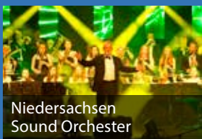
Niedersachsen Sound Orchester