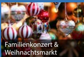
Familienkonzert & Weihnachtsmarkt